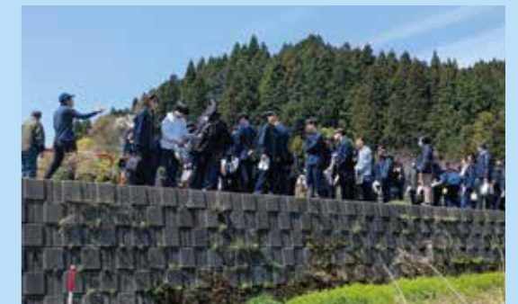
地域の方々と協働しながら郷土の魅力や課題を学ぶ